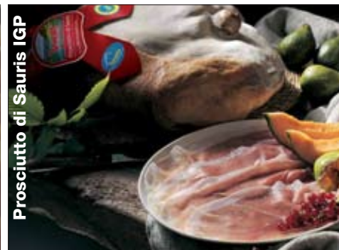
Prosciutto di Sauris IGP