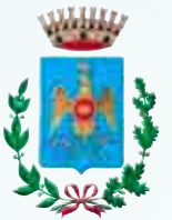
Comune di Castions di Strada