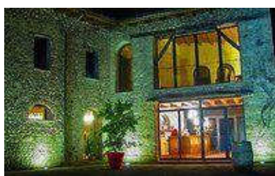
Il locale Friûl Marangon a Orgnano

Nell'anno di Expo l'idea di una vita secondo natura affascina sempre di più l'uomo moderno. Dal suo rifugio montano, lontano dai clamori della manifestazione milanese, l'autore tenta una via più autentica e meno immediata alla sostenibilità . Il suo percorso parte dall'esperienza di contadino in felice decrescita per elaborare il manifesto del buon selvaggio. Sulla tavola porta un'alimentazione scarna, integrale e frugale a prevenzione delle malattie del benessere. Tra le sue priorità il senso di appartenenza ai luoghi e alla comunità. Il buon selvaggio non rifiuta la tecnologia ma accetta la sfida di un suo uso equilibrato, non lancia dogmi come macigni ma si pone domande e sperimenta uno stile di vita sempre aperto al confronto. Si districa tra gli inganni del vivere quotidiano elaborando una personalissima via alla felicità . A fare da sfondo, l'estremo rifugio di sempre: la Montagna – quelle Alpi segrete dove il buon selvaggio dei tempi moderni potrà rintracciare la solitudine terapeutica che in un continente sovrappopolato è un bene assai raro.